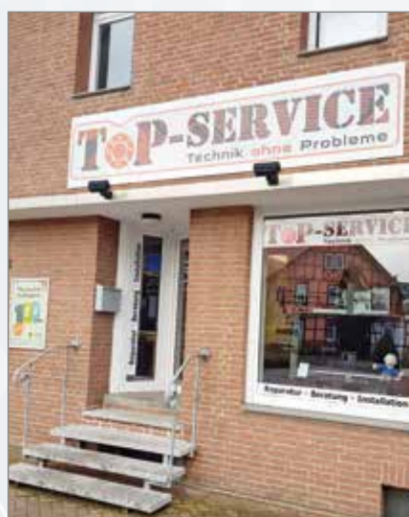
Die Filiale in Hämelerwald in der Sternstraße 12.