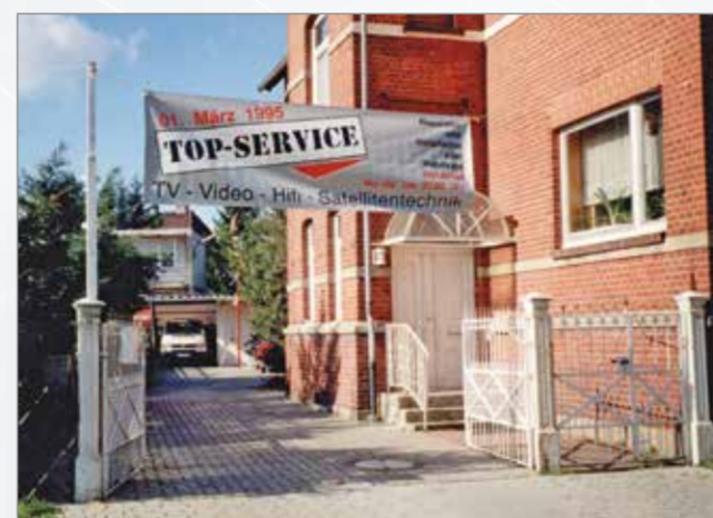
Erster Standort des Top-Service: die Peiner Sundernstraße.