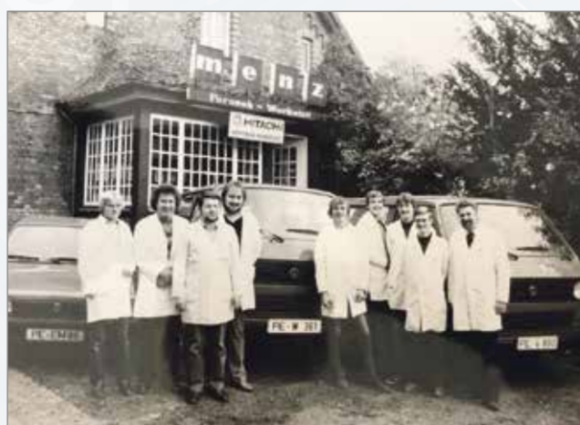
Die alte Werkstatt der Firma Menz.